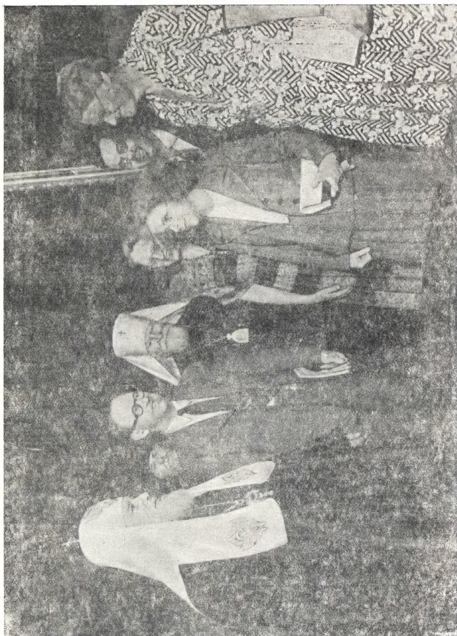
ДЕЛЕГАЦИЯ АНГЛИЙСКОГО ХРИСТИАНСКОГО ОБЩЕСТВА ДРУЗЕЙ (КВАКЕРОВ) В МОСКОВСКОЙ ПАТРИАРХИИ